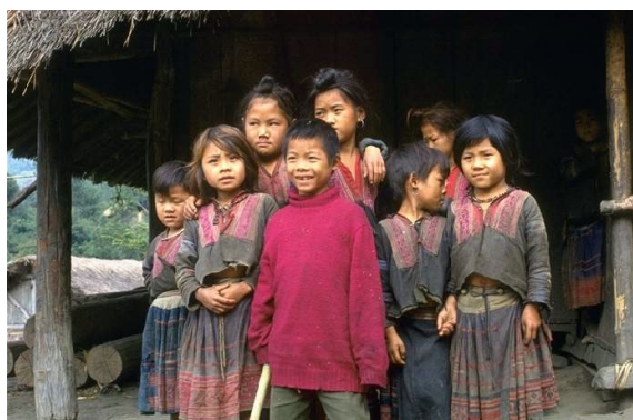
Enfants des ethnies au Nord Viet Nam

Ce paradoxe nous conforte dans notre objectif humanitaire et c'est pourquoi nous serons le plus longtemps possible présents par nos actions, si modestes soient-elles, mais si pleines d'espérance pour l'avenir.