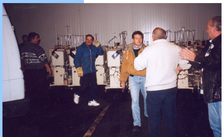
Au déchargement à Sètes. Voilà, tout y est ! Bravo et Merci à tous !